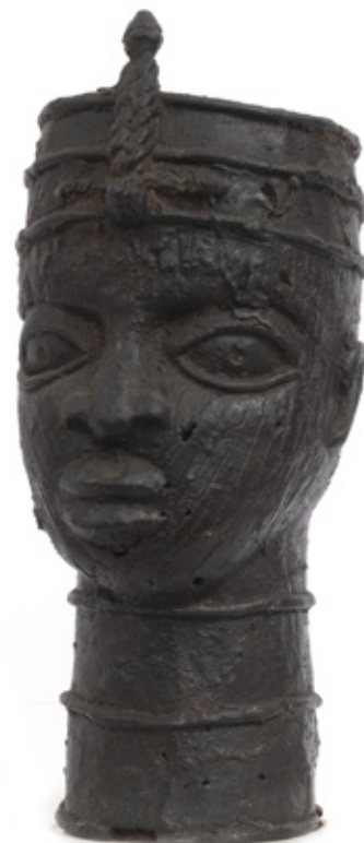
CABEÇA DIGNATÁRIO. ESCULTURA EM BRONZE. BENIN. 22,5 CM. R$ 6.000