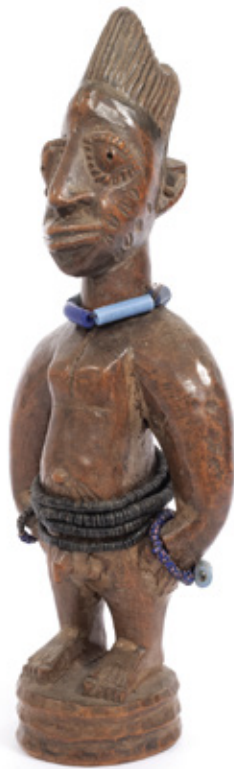
IBEJI. MADEIRA E COLARES DE MIÇANGAS. NIGÉRIA. 29 X 10 CM. R$ 2.000