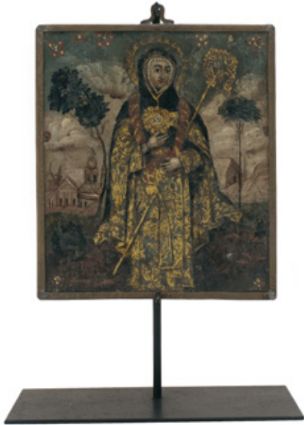
SANTA RITA. ÓLEO SOBRE CHAPA DE COBRE. 20 X 14 X 6 CM.