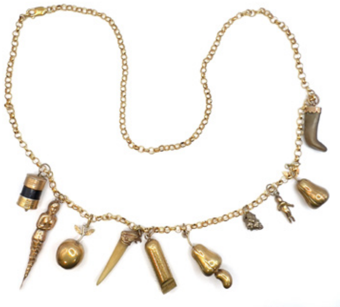
JOIA DE CRIOULA. CORRENTE DE ELOS EM OURO COM 10 BERLOQUES. 33 CM. PESO 64GR.