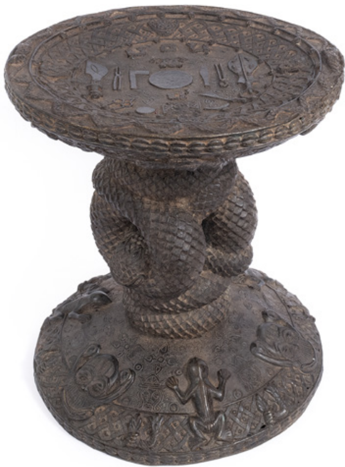
TAMBORETE DE PRESTÍGIO BANCO EM BRONZE. BENIN, NIGÉRIA. 42,5 X 36 CM.