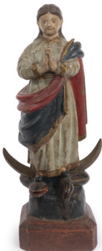
IMAGEM DE NOSSA SENHORA. DA CONCEIÇÃO ESCULTURA EM MADEIRA POLICROMADA. C. 1800. 22 X 7 X 5 CM.