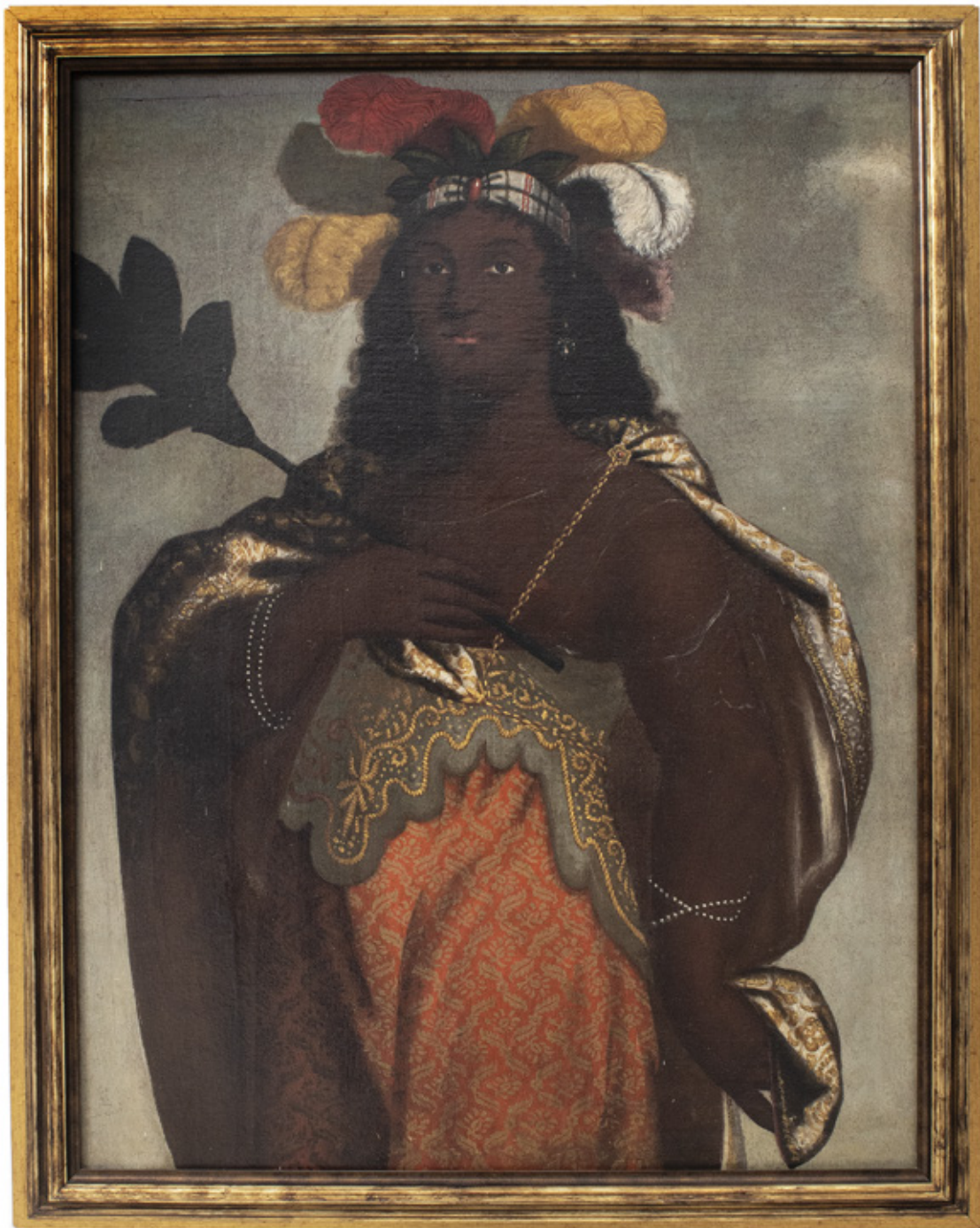
SIBILA AGRIPINA. ÓLEO SOBRE TELA. 100 X 76 CM.