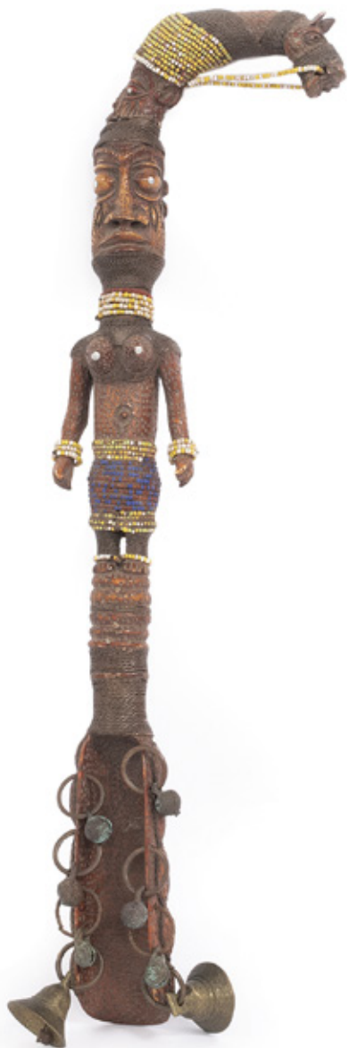
BONECA NAMJI. ESCULPIDA EM MADEIRA MACIÇA, ADORNADA COM COLARES DE CONTAS MULTICOLORIDAS. 27 X 14 CM.