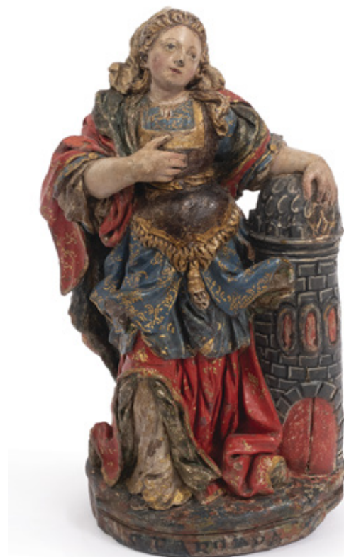
IMAGEM DE SANTA BÁRBARA. ESCULTURA EM TERRACOTA. PORTUGAL, SÉCULO XVIII. 22 X 12 CM.