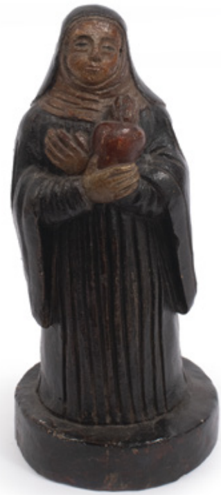
IMAGEM DE SANTA GERTRUDES. ESCULTURA EM TERRACOTA. C. 1800. 19 X 7 CM. R$ 4.000