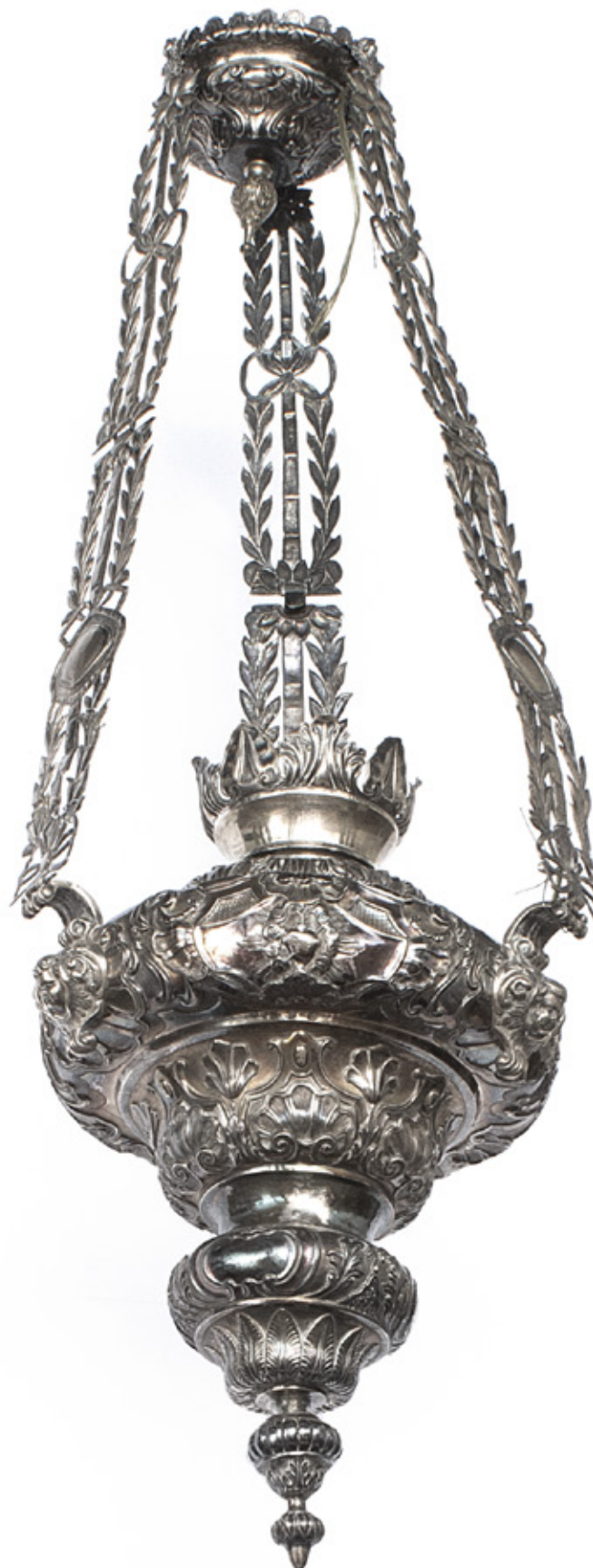
LAMPADÁRIO EM PRATA, SÉCULO XIX. 110 X 33 CM. R$ 30.000