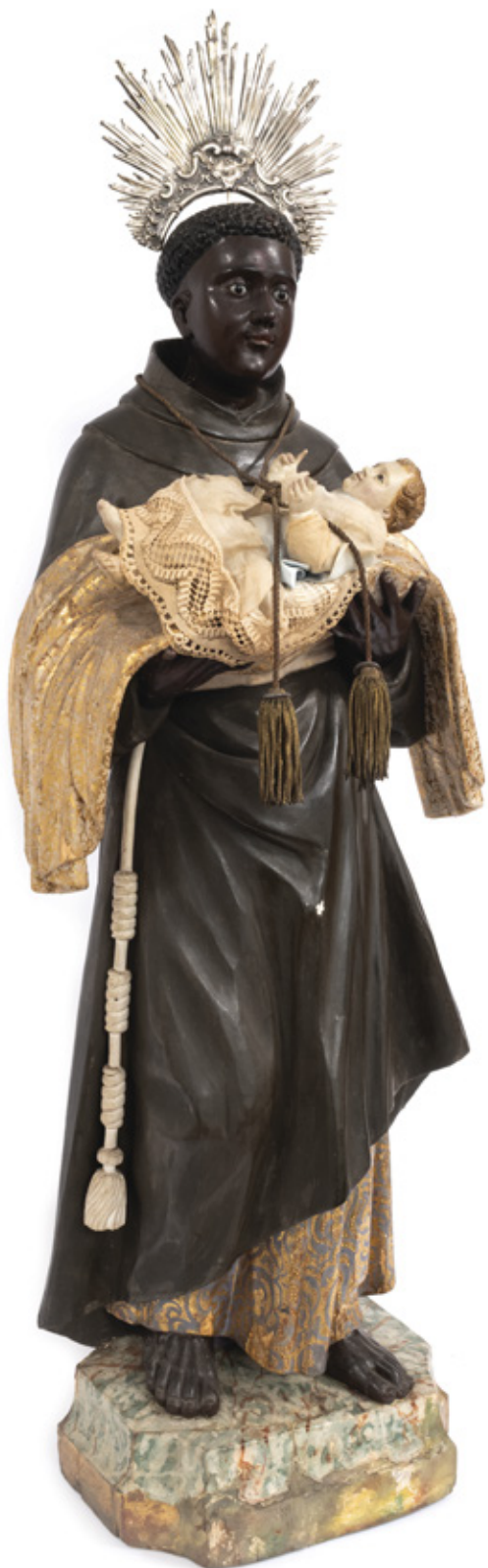
IMAGEM DE SANTO ANTONIO DE CATEGERÓ ESCULTURA EM MADEIRA POLICROMADA E DOURAÇÃO. BRASIL, SÉCULO XVIII. 85 X 35 X 21,5X CM.