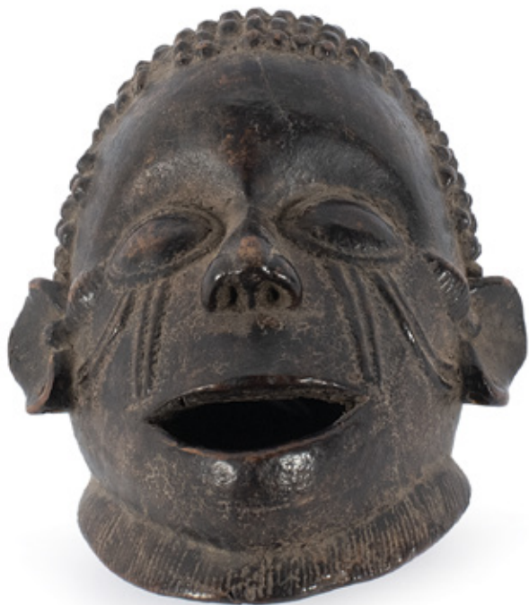
CABEÇA. ESCULTURA EM MADEIRA. BENIN. 23 X 18 CM. R$ 3.000