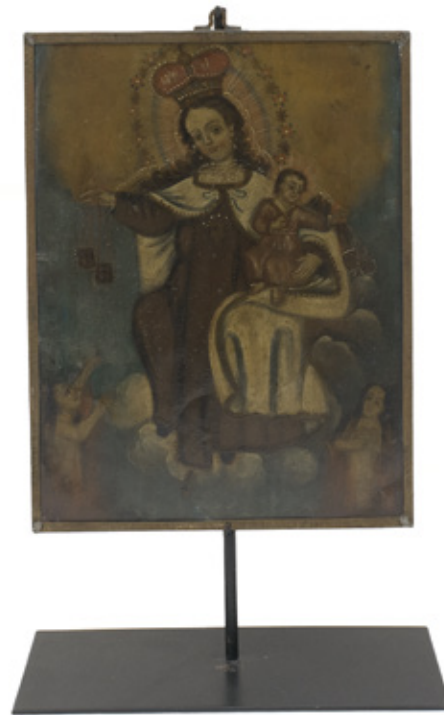
NOSSA SRA. DO CARMO. ÓLEO SOBRE CHAPA DE COBRE.