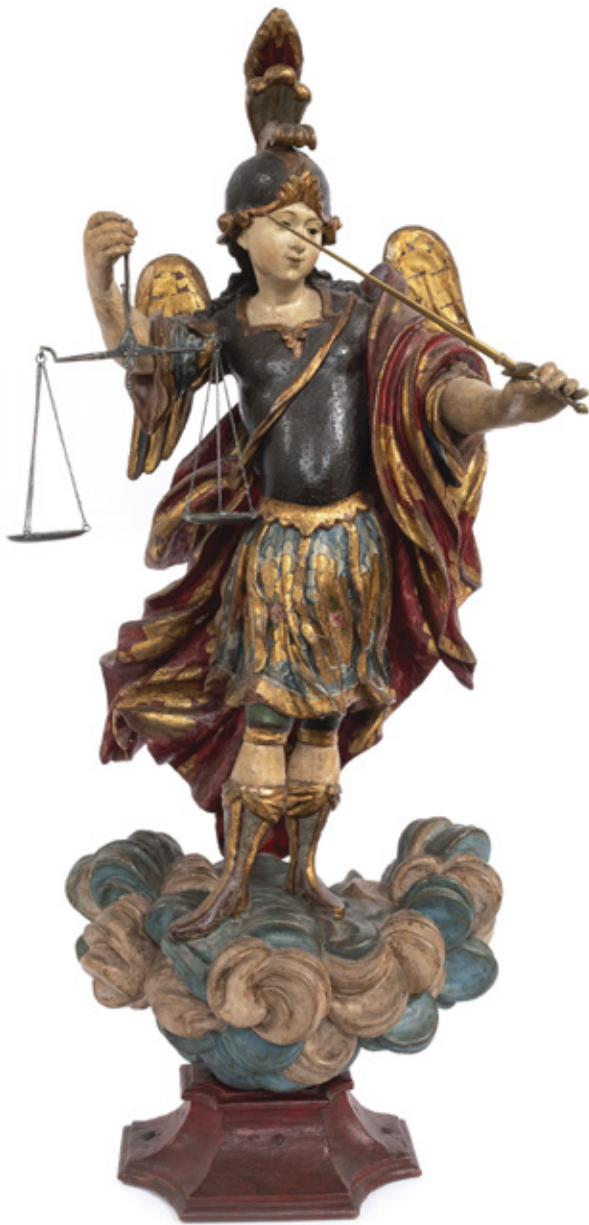
IMAGEM DE SÃO MIGUEL ARCANJO. ESCULTURA EM MADEIRA POLICROMADA. BRASIL, SÉCULO XVIII. 68 X 29 CM.