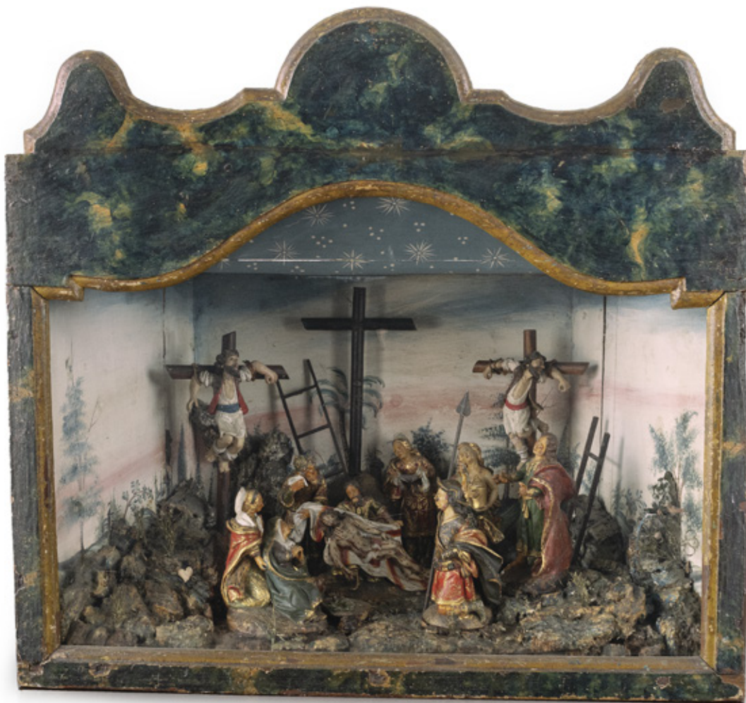
MAQUINETA DA PAIXÃO DE CRISTO. IMAGENS EM MADEIRA POLICROMADA MONTADAS EM CAIXA DE MADEIRA E VIDRO. SÉCULO XVIII. 51 X 51,5 X 30 CM.