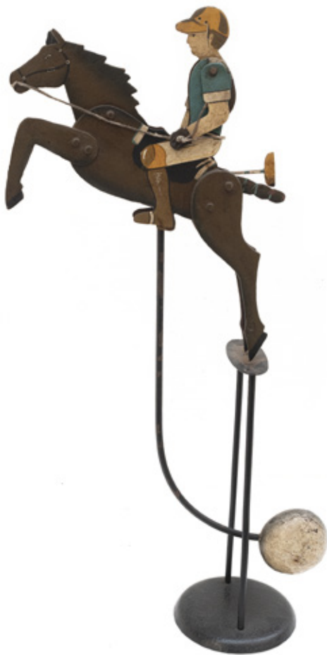
ARTE POPULAR. EQUILÍBRIO CAVALO DE CORRIDA. FERRO POLICROMADO. 50 CM. R$ 3.000