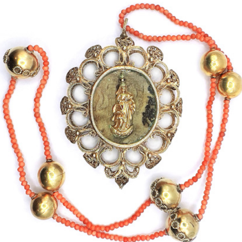
PENDENTE RELIGIOSO NOSSA SENHORA DA CONCEIÇÃO. COLAR COM CONTAS DE CORAL E BOLOTAS EM PRATA DOURADA. BRASIL, SÉCULO XVIII. 44 X 7 CM.