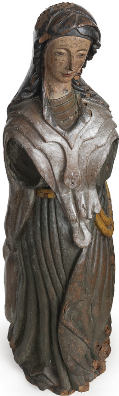
FIGURA DE PROA. ESCULTURA EM MADEIRA POLICROMADA. SÉCULO XVIII. 120 X 36 X 40 CM. R$ 25.000