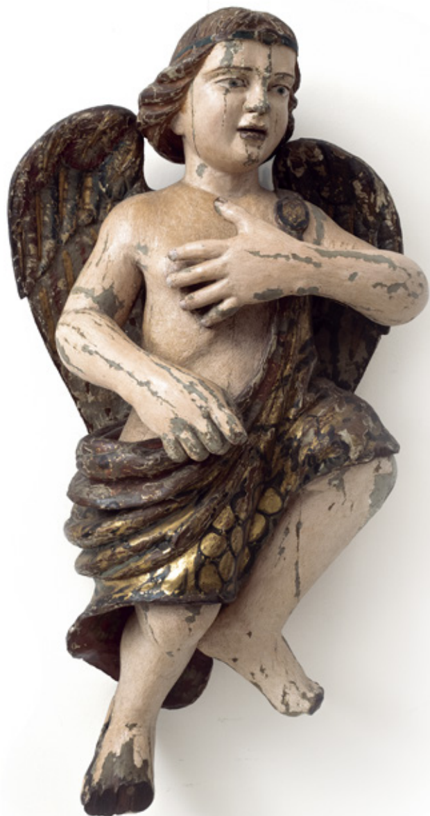
IMAGEM DE ANJO. ESCULTURA EM MADEIRA POLICROMADA. BRASIL, SÉCULO XVIII. 92 X 50 X 33 CM.