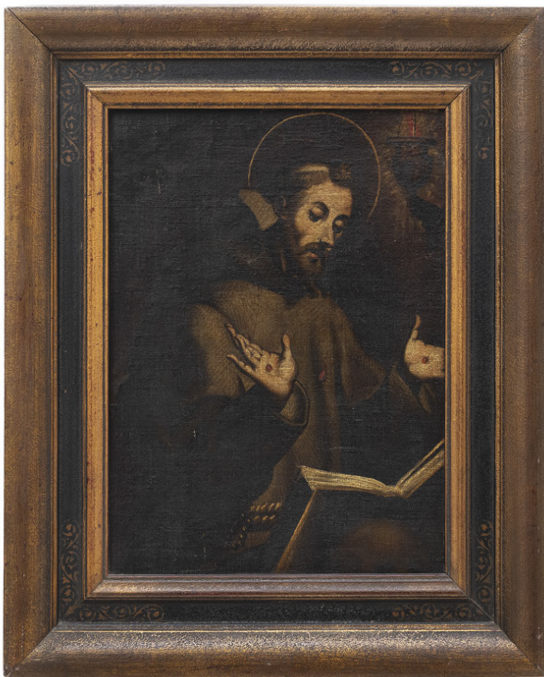
IMAGEM DE SANTO ESTIGMATIZADO. ÓLEO SOBRE TELA. 41,5 X 30,5 CM