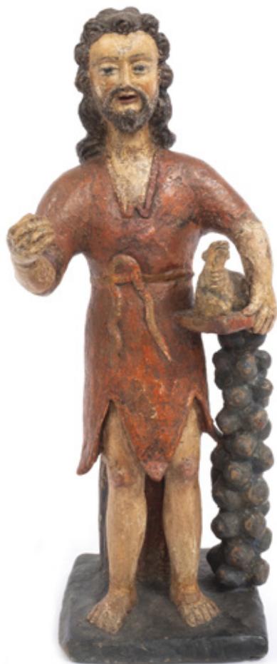
IMAGEM DE SÃO JOÃO BATISTA. ESCULTURA EM TERRACOTA PINTADA. 49 X 20 X 16 CM.