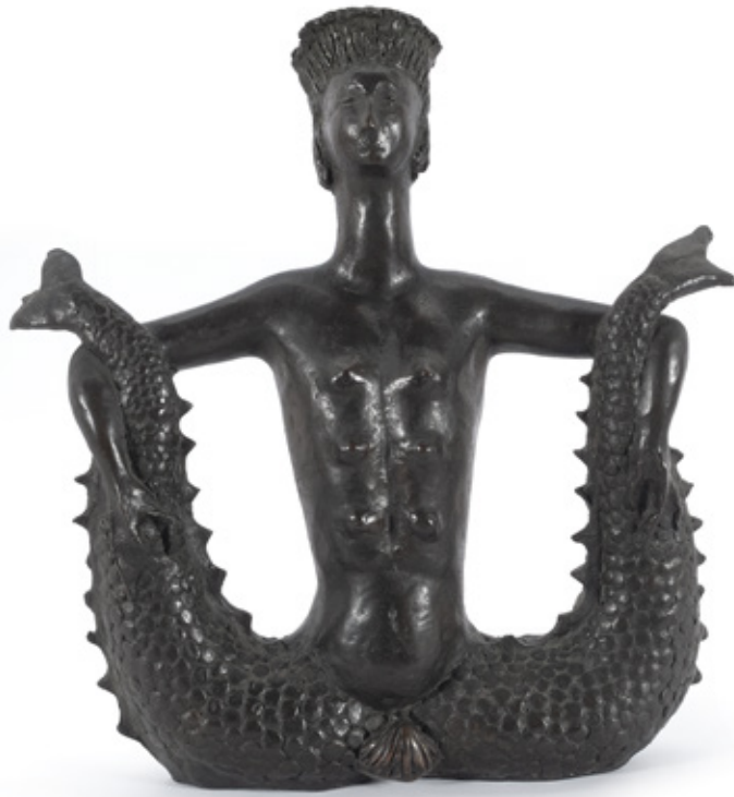
MELUSINA. ESCULTURA EM BRONZE. 40 X 37 CM.