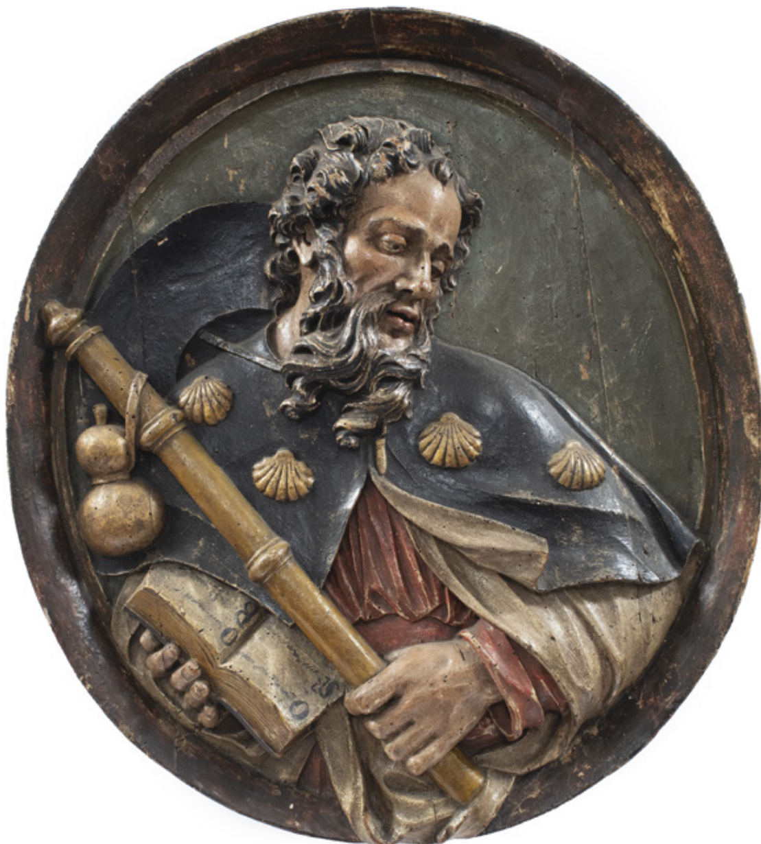
IMAGEM DE SÃO TIAGO. ESCULTURA EM MADEIRA POLICROMADA. ESPANHA, SÉCULO XVII. 69 X 62 CM.