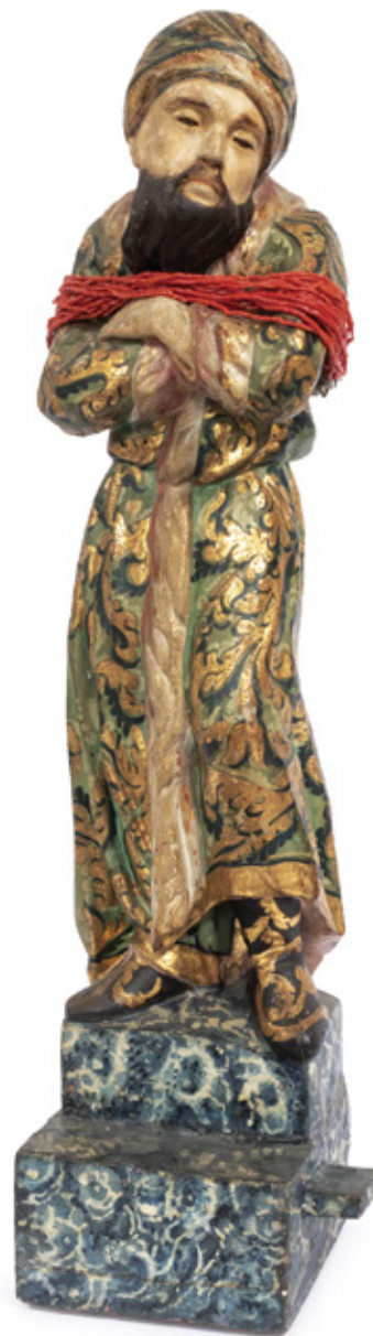
IMAGEM DE SÃO PEDRO ARREPENDIDO. ESCULTURA EM MADEIRA POLICROMADA. BAHIA, SÉCULO XIX. 64 CM.