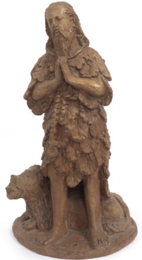
IMAGEM DE SANTO ONOFRE. ESCULTURA EM BARRO COZIDO, C. 1800. 24 X 13 X 8 CM.