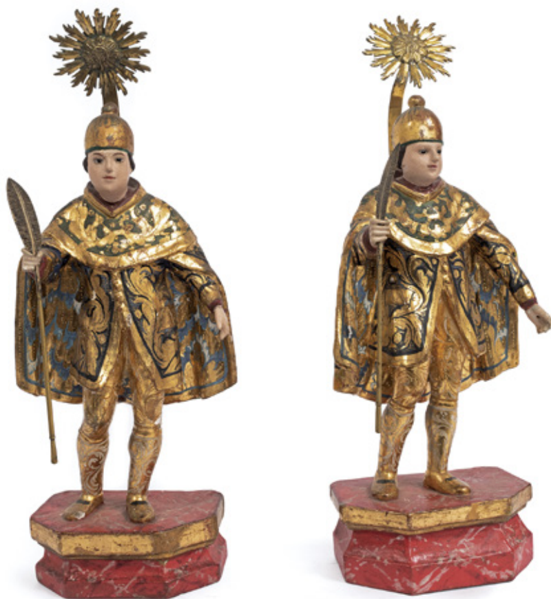
SÃO COSME E SÃO DAMIÃO. ESCULTURA EM MADEIRA POLICROMADA E METAL. BRASIL, SÉCULO XVIII. 24X 10 X 7 CM.