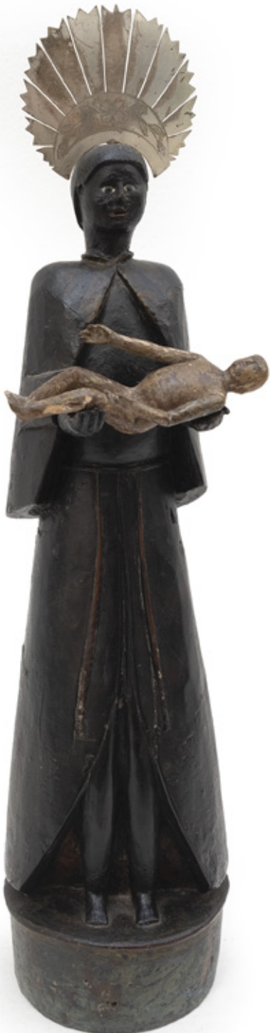
IMAGEM DE SÃO BENEDITO. ESCULTURA EM MADEIRA POLICROMADA. SÉCULO XVIII. 52 CM. R$ 4.000