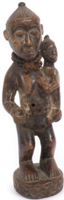
MATERNIDADE. ESCULTURA EM MADEIRA. ÁFRICA OCIDENTAL. 20 CM.