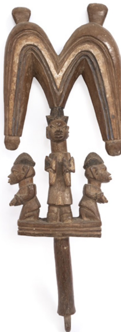
OXÊ DE XANGÔ. ESCULTURA EM MADEIRA PINTADA. BENIN. 63 X 25 CM.

Reproduzido no livro O Universo Mítico Hector Julio Bernabó, o Baiano Carybé, Museu Afro Brasil, São Paulo - SP, p. 59.