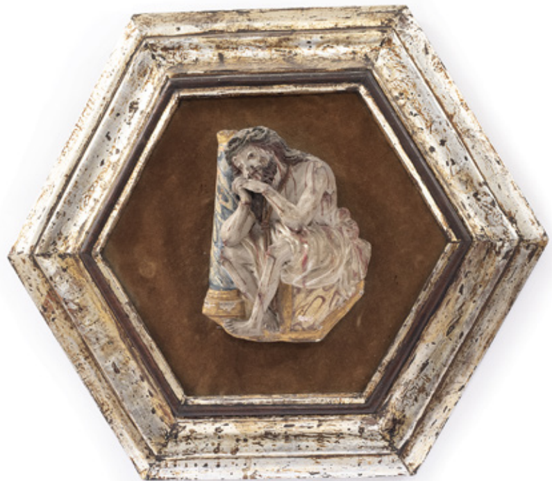
CRISTO DA COLUNA. CERÂMICA POLICROMADA. EUROPA, SÉCULO XVIII. 16 X 12 CM.