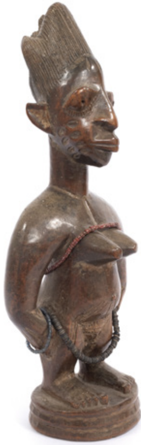
IBEJI. MADEIRA E COLARES DE MIÇANGAS. NIGÉRIA. 31 X 11 CM. R$ 2.000