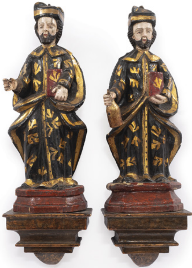
IMAGEM DE COSME E DAMIÃO ESCULTURA EM MADEIRA POLICROMADA.