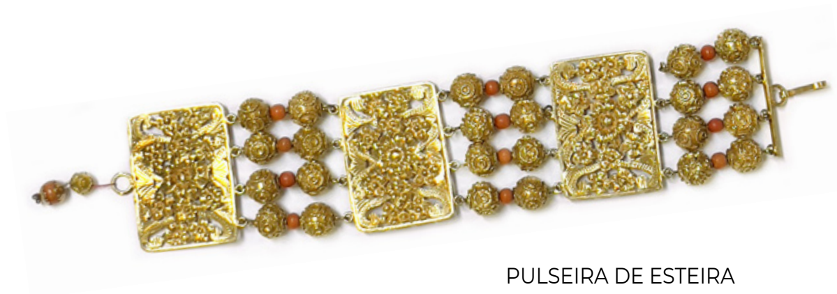
PULSEIRA DE ESTEIRA EM OURO MOLDADO, FILIGRANADO E CORAIS. BRASIL, SÉCULO XIX. 20 CM. PESO TOTAL 60GR.