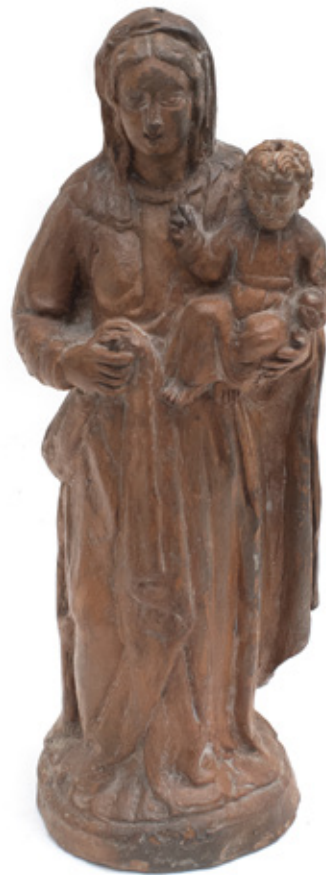
IMAGEM DE NOSSA SENHORA E O MENINO JESUS. ESCULTURA EM CERÂMICA. 24,5 X 10 CM.