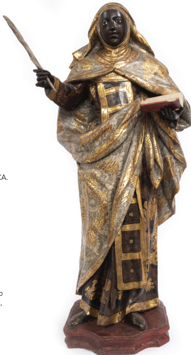
IMAGEM DE SANTA ROSA EGIPCÍACA. ESCULTURA EM MADEIRA POLICROMADA E DOURAÇÃO. SÉCULO XVIII. 77 CM.