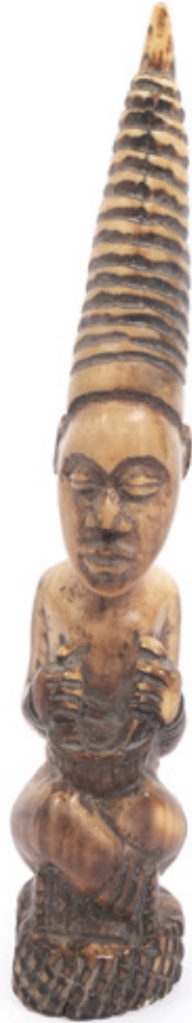
FIGURA DE NOBRE. ESCULTURA EM MARFIM. BENIN, NIGÉRIA. 21 X 4 CM.