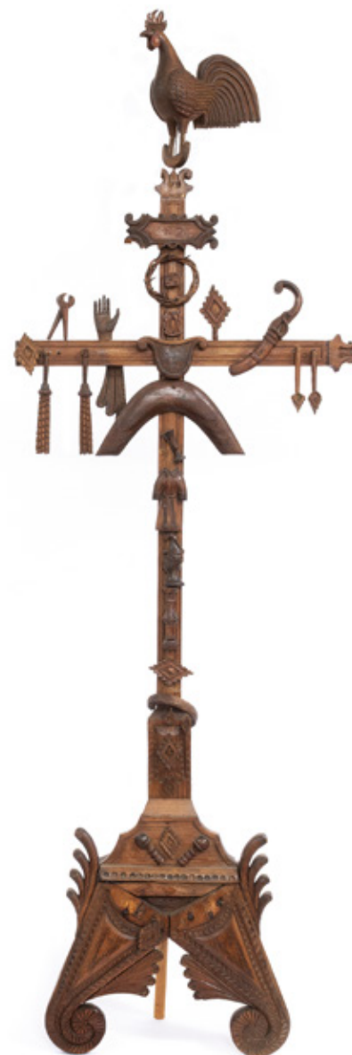
CRUZ COM SÍMBOLOS DO CALVÁRIO EM MADEIRA POLICROMADA. BRASIL, SÉCULO XIX. 122 X 40 CM.

Reproduzido no catálogo da exposição "Barroco Ardente e Sincrético Luso-Afro-Brasileiro", Museu Afro Brasil, São Paulo - SP, p. 193.