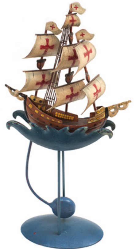
ARTE POPULAR. EQUILÍBRIO DE CARAVELAS. FERRO PINTADO. 39 X 19 CM. R$ 6.000,00