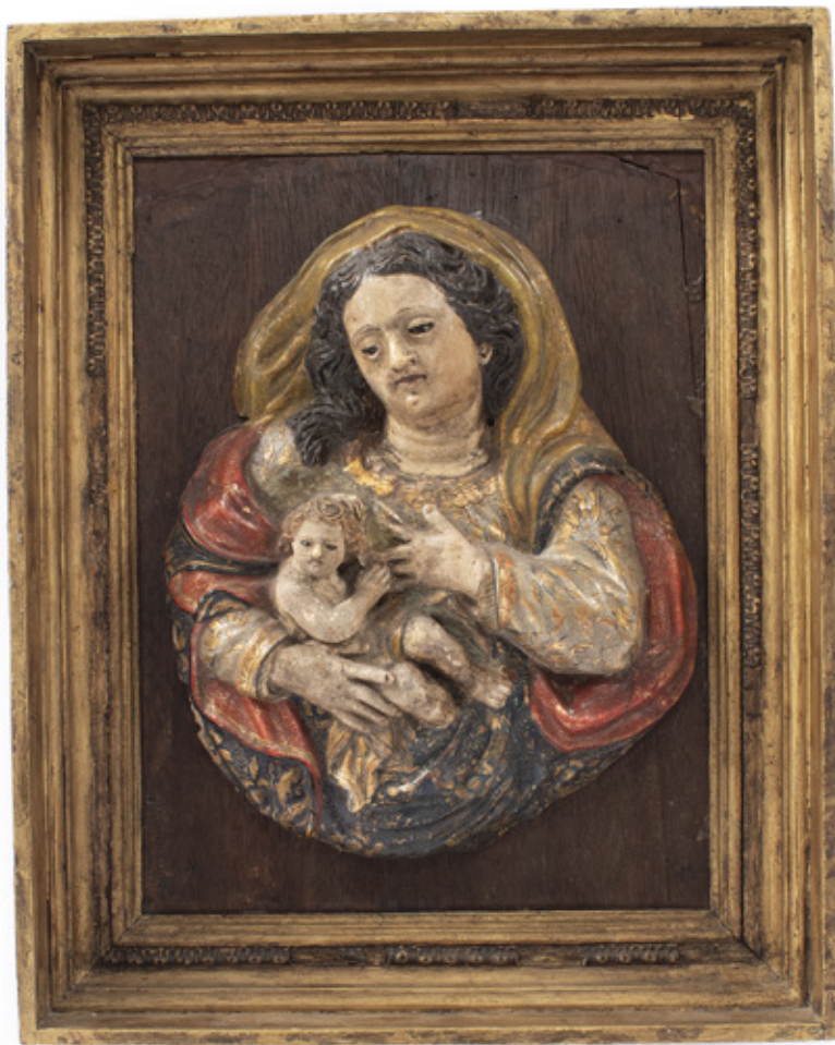
IMAGEM DE NOSSA SENHORA DO LEITE. ESCULTURA EM MADEIRA POLICROMADA. EUROPA, C. 1800. 29 X 24 CM.