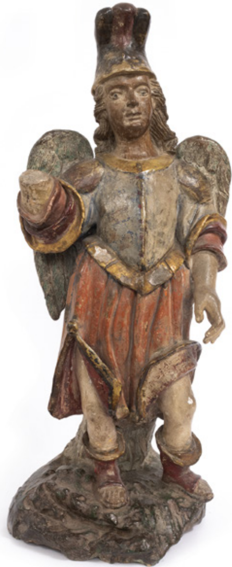
IMAGEM DE SÃO MIGUEL ESCULTURA EM TERRACOTA. SÉCULO. XIX. 59 X 22 X 20 CM.