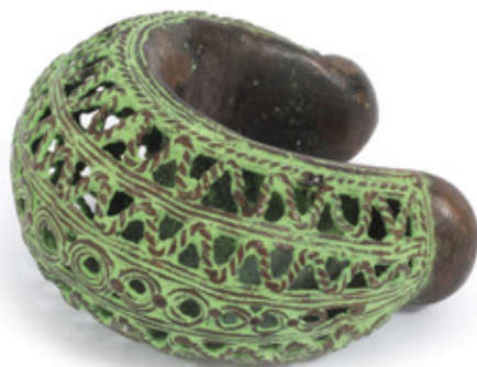
PULSEIRA – MOEDA. BRONZE DE BENIN. 11 X 11,5 CM. R$ 2.000