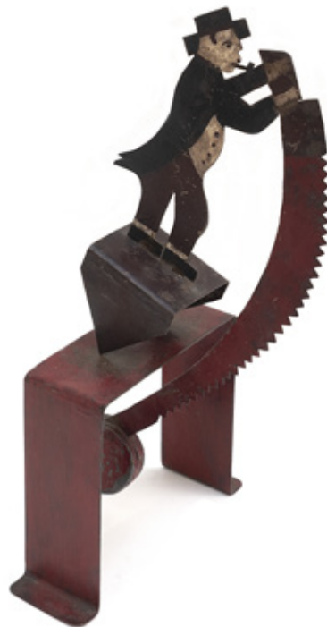
ARTE POPULAR. EQUILÍBRIO, HOMEM. FOLHA DE FERRO POLICROMADA. 31 CM. R$ 2.000