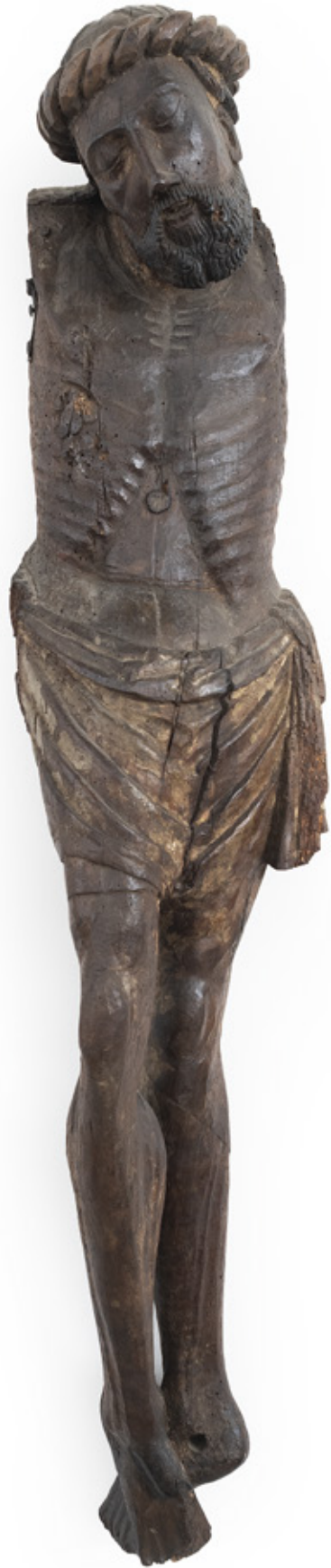
IMAGEM DE CRISTO JACENTE. ESCULTURA EM MADEIRA. SÉCULO XVI. 145 X 33 X 29 CM.