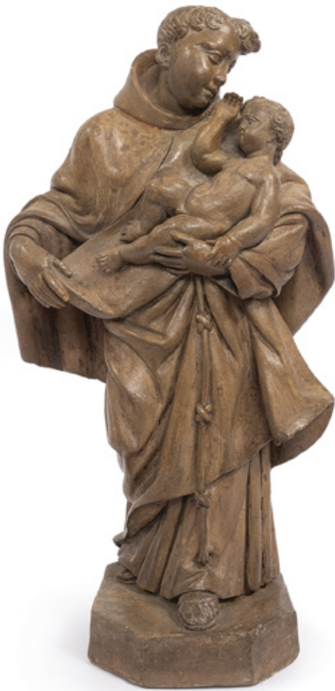
IMAGEM DE SANTO ANTÔNIO. ESCULTURA EM TERRACOTA, SÉCULO XVIII. 28 X 16 X 10,5 CM.