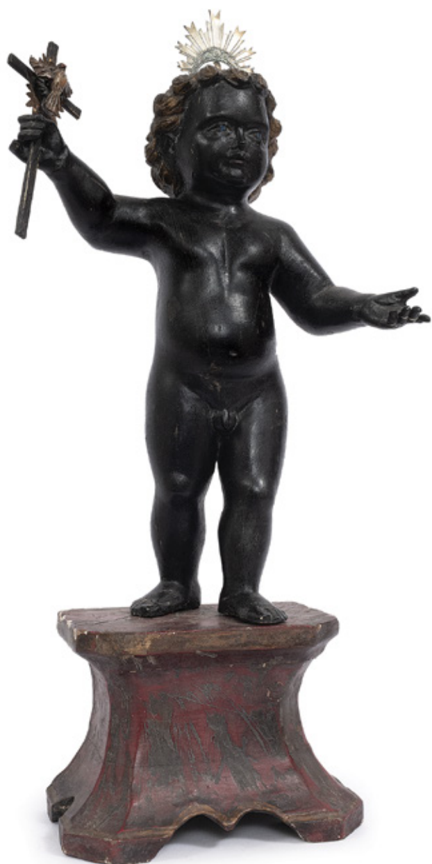
IMAGEM DE MENINO DEUS ESCULTURA EM MADEIRA POLICROMADA. SÉCULO XVIII. 30 X 15 X CM.