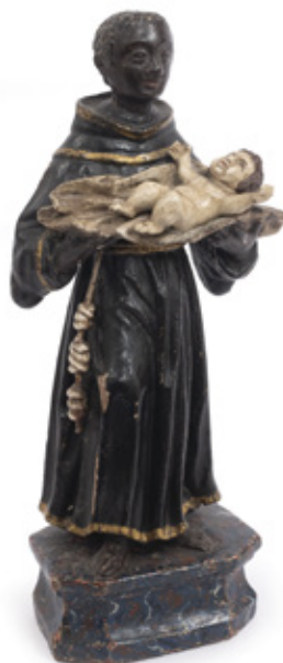
SANTO ANTÔNIO DO CATEGERÓ. ESCULTURA EM MADEIRA POLICROMADA. 26 X 6 X 9 CM.