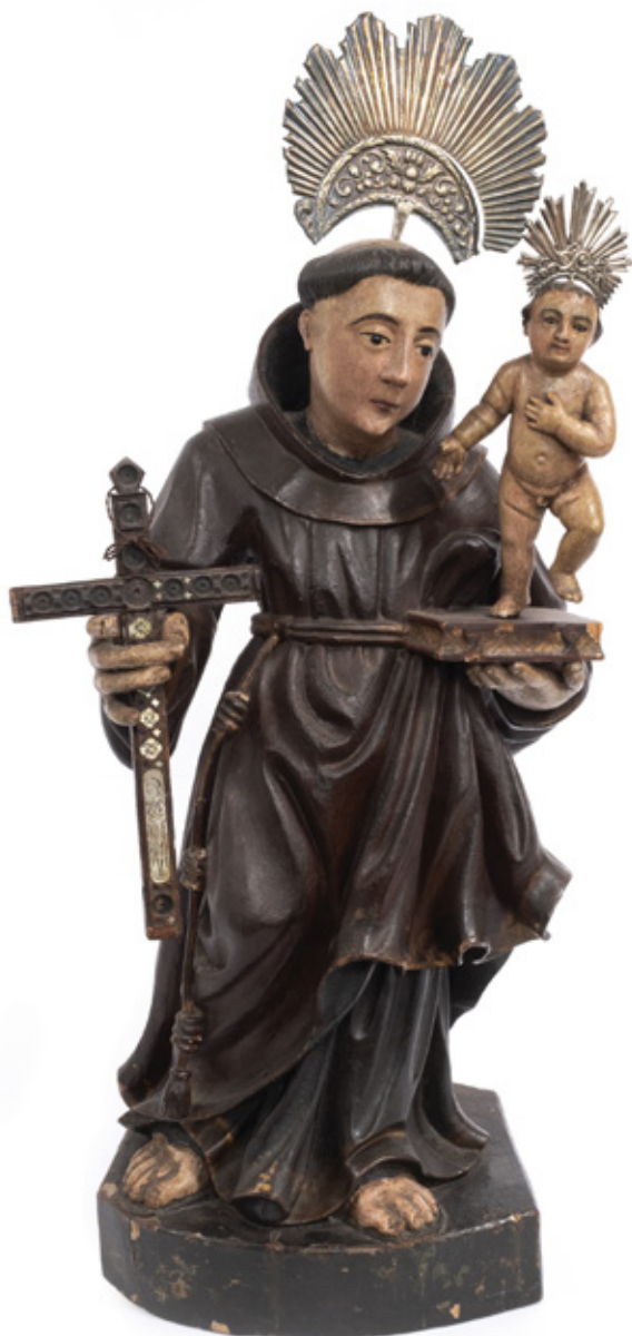
IMAGEM DE SANTO ANTÔNIO. ESCULTURA EM MADEIRA POLICROMADA. SÉCULO XVIII. 60 X 26 X 20 CM.