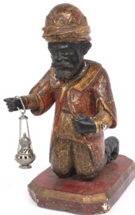
IMAGEM DE COSME E DAMIÃO. ESCULTURA EM MADEIRA POLICROMADA. SÉCULO XVIII/XIX. 60 X 27 X 42 CM.