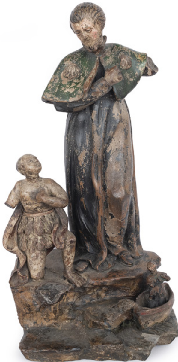
IMAGEM DE SANTIAGO DE COMPOSTELA. ESCULTURA EM BARRO COZIDO POLICROMADO. EUROPA, SÉCULO XVIII. 40 X 20 X 12 CM.