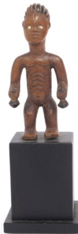
FIGURA DE ANCESTRAL. ESCULTURA EM MADEIRA TALHADA. KONGO. 11 CM.