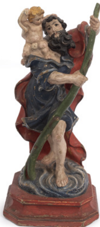
IMAGEM DE SÃO CRISTOVÃO. ESCULTURA EM MADEIRA POLICROMADA. SÉCULO XVIII. 21 X 9 X 8 CM.