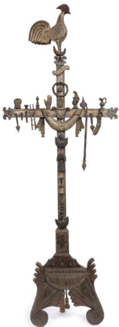
CRUZ COM OS SÍMBOLOS DO CALVÁRIO EM MADEIRA POLICROMADA. BRASIL, SÉCULO XVII. 111 X 40 CM.