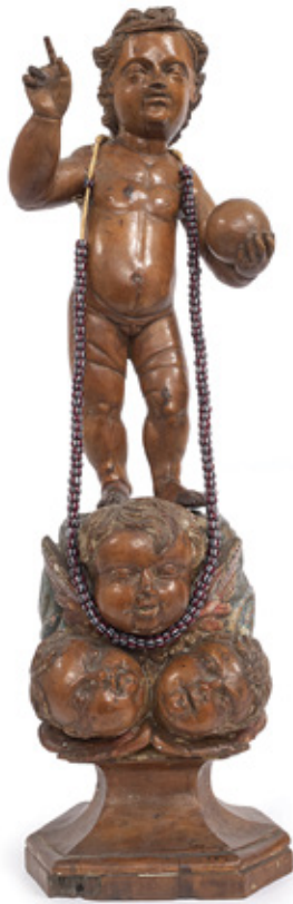
IMAGEM DE MENINO JESUS ESCULTURA EM MADEIRA POLICROMADA. SÉCULO XVIII. 51 X 12 X 10 CM.