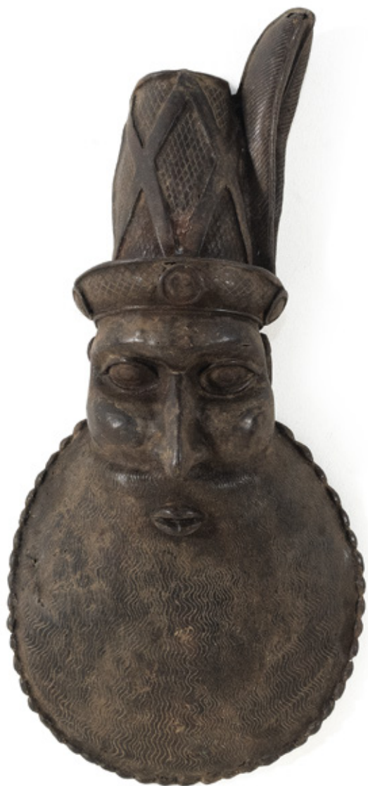
FIGURA EUROPEIA. ESCULTURA EM BRONZE. BENIN. 60 X 28 X 12 CM.