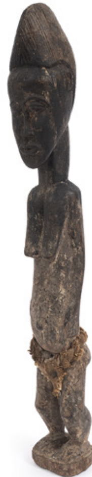
MATERNIDADE. ESCULTURA EM MADEIRA. POVO IORUBÁ. 46 CM.