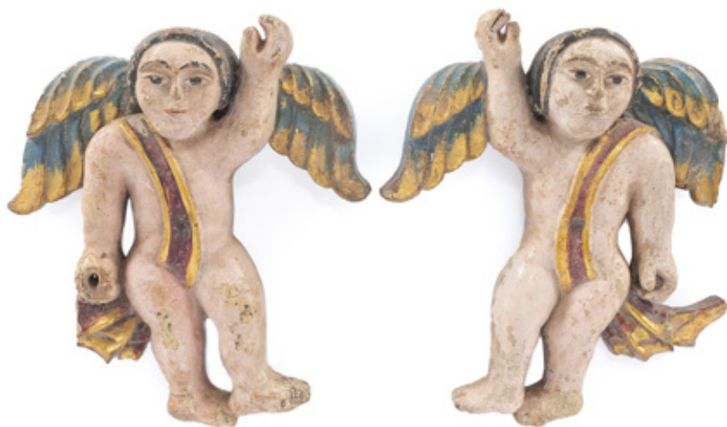
IMAGEM DE PAR DE ANJOS ESCULTURA EM MADEIRA POLICROMADA E CRAVO EM METAL. SÉCULO XVIII. 28 X 22,5 CM.

Reproduzido no catálogo da exposição "Ardente e Sincrético Luso-Afro-Brasileiro", Museu Afro Brasil, São Paulo - SP, p. 200.