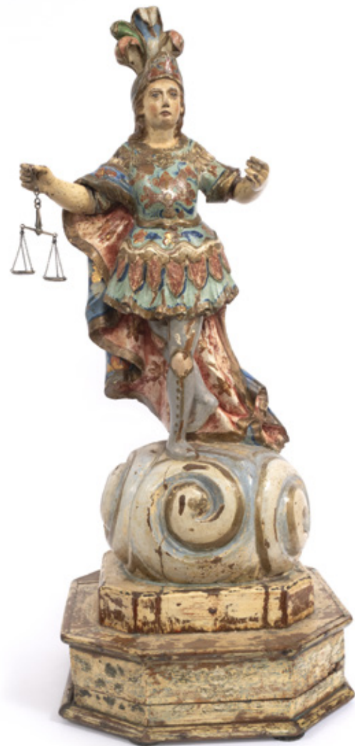
IMAGEM DE SÃO MIGUEL ARCANJO. ESCULTURA EM MADEIRA POLICROMADA. PORTUGAL, SÉCULO XVIII. 64 X 27 X 25 CM.