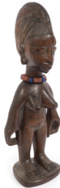
IBEJI. ESCULTURA EM MADEIRA E COLAR DE MIÇANGAS. NIGÉRIA. 23 X 8,5 CM. R$ 2.000