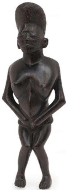
FIGURA FEMININA. ESCULTURA EM MADEIRA. ÁFRICA OCIDENTAL. 24 X 7 CM.