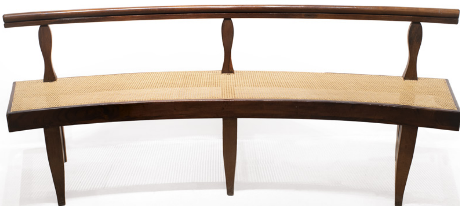
BANCO PARA QUATRO LUGARES EM MEIA LUA, EM MADEIRA BRASILEIRA, ENCOSTO VAZADO COM ASSENTO EM PALHINHA. SÉCULO XIX. 89 X 237 X 57,5 CM.