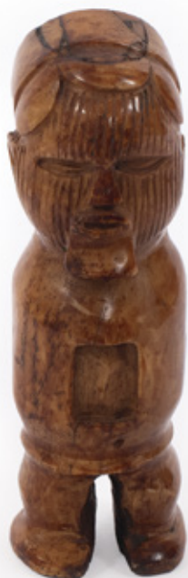
FIGURA DE ANCESTRAL. ESCULTURA EM MARFIM. NIGÉRIA. 10 CM.