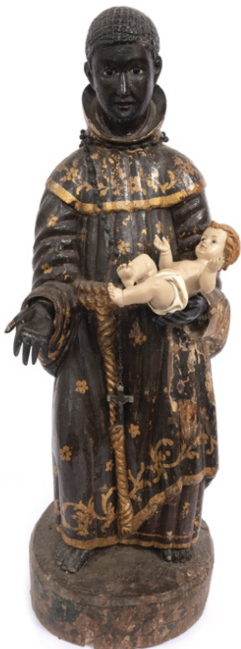
SÃO BENEDITO. ESCULTURA EM MADEIRA POLICROMADA E DOURAÇÃO. SÉCULO XVIII. 45 X 20,5 X 20 CM.