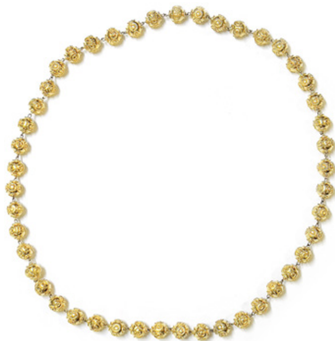
COLAR COM BOLOTAS DE CONFEITO EM PRATA DOURADA. BRASIL. 36 CM FECHADO.