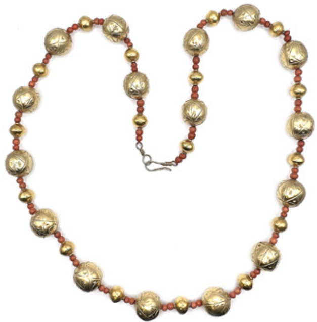
JOIA DE CRIOULA. COLAR COM CONTAS DE CORAL E OURO. 34 CM. PESO BRUTO 76GR.