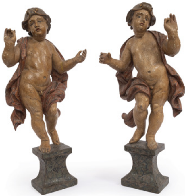
PAR DE QUERUBINS ESCULTURA EM MADEIRA POLICROMADA. BRASIL, C. 1800. 37 X 16 X 6 CM.