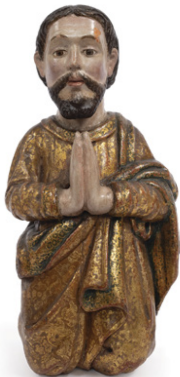
IMAGEM DE SÃO JOSÉ DE BOTAS. ESCULTURA EM MADEIRA POLICROMADA E DOURAÇÃO. C. 1800. 32 X 15 CM.