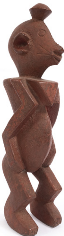
POVO MUMUYE IAGALAGANA. ESCULTURA EM MADEIRA. NIGÉRIA. 14 CM.