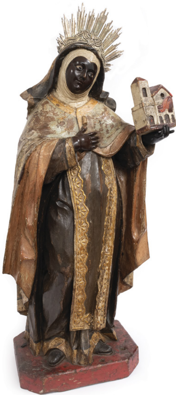
IMAGEM DE SANTA IFIGÊNIA. ESCULTURA EM MADEIRA POLICROMADA. SÉCULO XVIII. 88 X 30 X 24 CM.