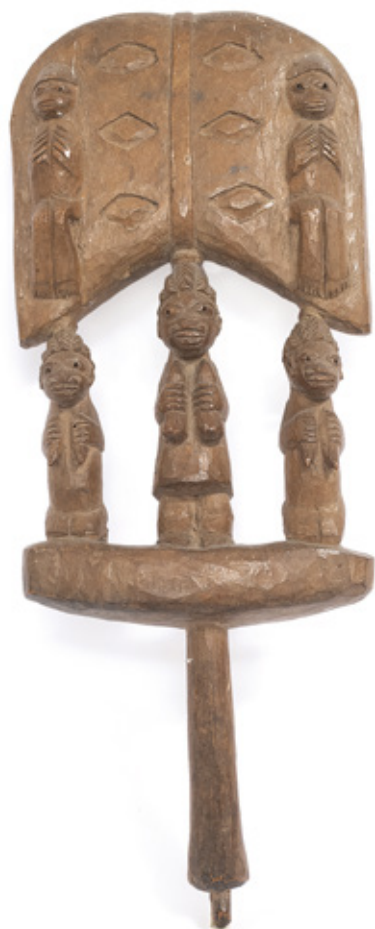
OXÊ DE XANGÔ. ESCULTURA EM MADEIRA PINTADA. BENIN. 41 X 16 CM.