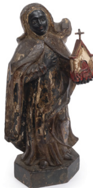
SANTA IFIGÊNIA. ESCULTURA EM MADEIRA POLICROMADA. BRASIL, SÉCULO XIX. 29 X 11 X 6 CM.