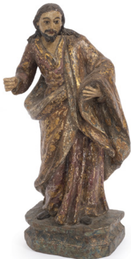
IMAGEM DE SAO JOSÉ. ESCULTURA EM MADEIRA POLICROMADA. BRASIL, SÉCULO XIX. 31 X 13 X 8,5 CM.