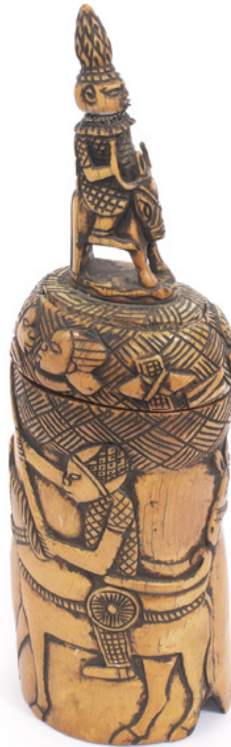
CAIXA EM MARFIM ENTALHADO COM FIGURAS DE GUERREIRO. PEGA DA TAMPA COM FIGURA DE NOBRE. ÁFRICA, SÉCULO XIX. 32 CM.