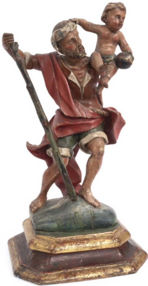
IMAGEM DE SÃO CRISTÓVÃO. ESCULTURA EM MADEIRA POLICROMADA. BRASIL, C. 1800. 48 X 26 X 20 CM.