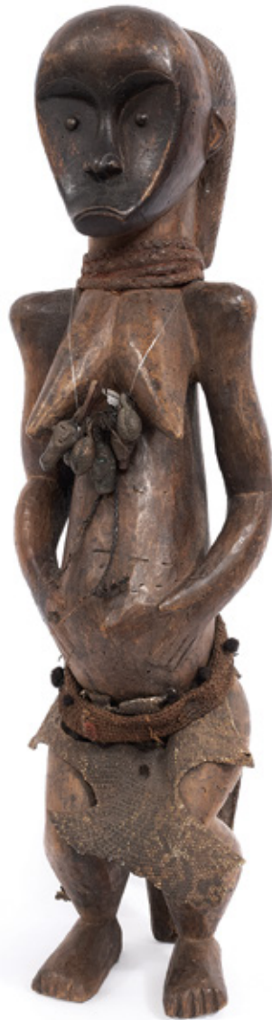
GESTANTE. ESCULTURA EM MADEIRA. GABÃO. 56 X 16 CM.