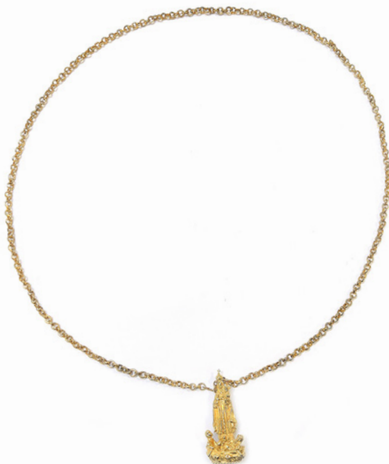
NOSSA SENHORA DA CARIDADE DO COBRE, PADROEIRA DE CUBA. CORRENTE EM OURO E INSERÇÃO DE BÚZIOS NA BASE. 61 CM FECHADA. PESO BRUTO 206GR.