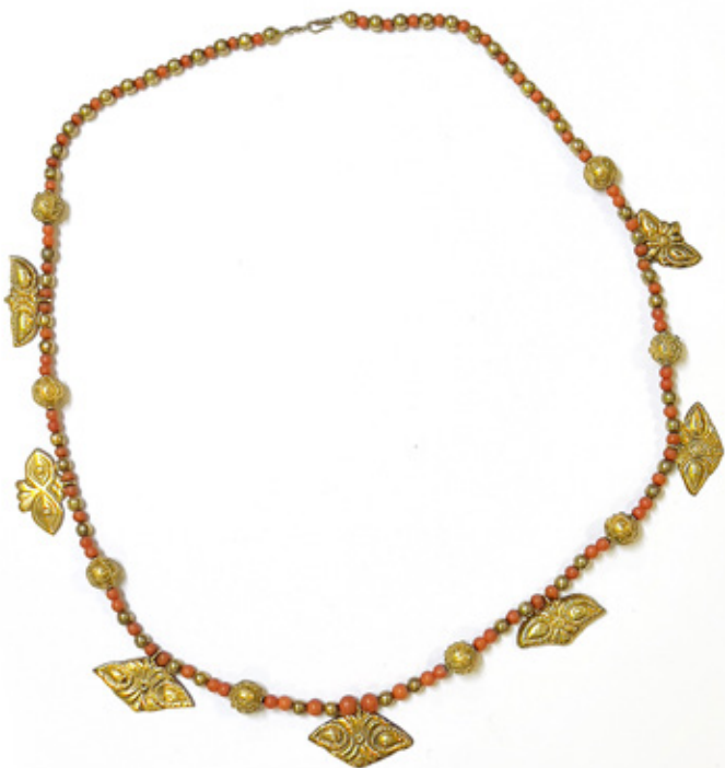
JOIA DE CRIOLA COLAR DE CONTAS E BOLOTAS DE CONFEITO EM PRATA DOURADA. 36 CM.