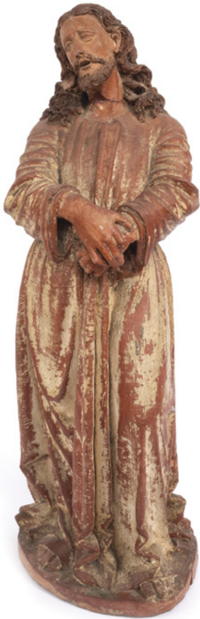
IMAGEM DE CRISTO ESCULTURA EM MADEIRA POLICROMADA. BRASIL, SÉCULO XVIII. 61 X 24 X 20,5 CM.