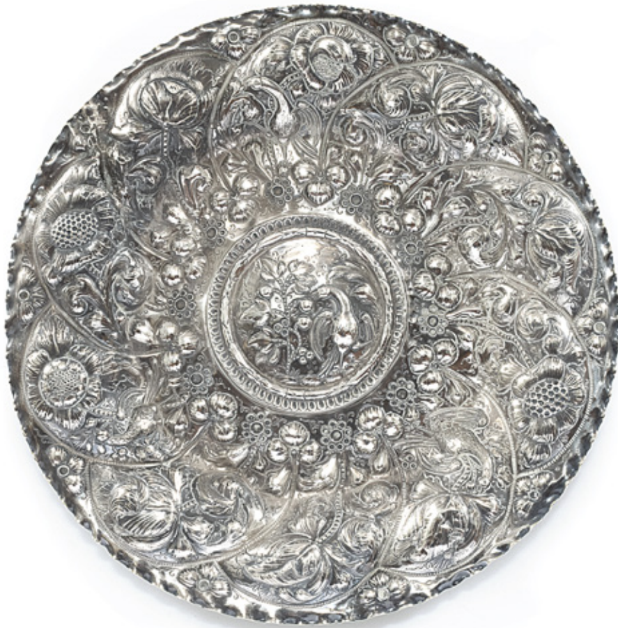
PRATO DE APRESENTAÇÃO EM PRATA. PORTUGAL, FINAL SÉCULO XVII. 40 CM DE DIÂMETRO. R$ 20.000