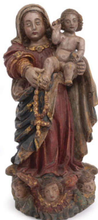
IMAGEM DE NOSSA SENHORA DO ROSÁRIO. ESCULTURA EM MADEIRA POLICROMADA. SÉCULO XVIII. 28 X 13 X 10 CM.