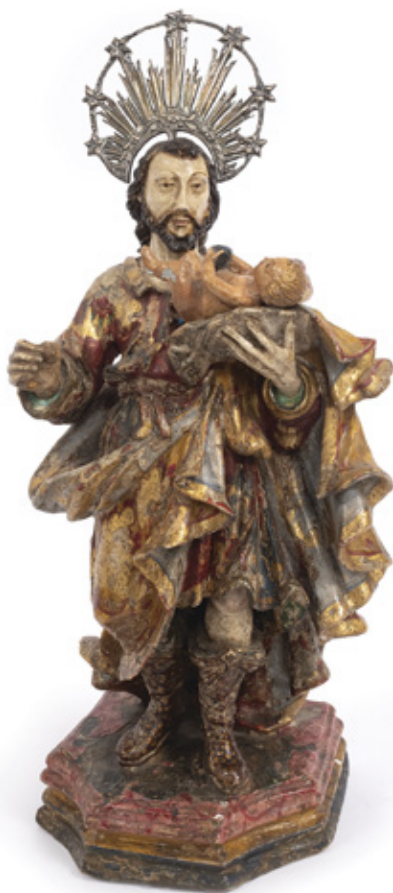
IMAGEM DE SÃO JOSÉ DE BOTAS. ESCULTURA EM TERRACOTA POLICROMADA. SÉCULO XIX. 32 X 14 X 10 CM.