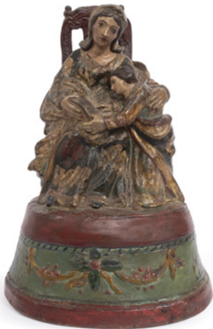
IMAGEM DE SANTANA MESTRA. ESCULTURA EM TERRACOTA. SÉCULO XIX.