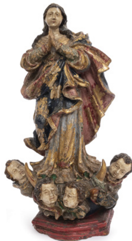
IMAGEM DE NOSSA SENHORA DA CONCEIÇÃO. ESCULTURA EM MADEIRA POLICROMADA. SÉCULO XIX. 31 X 17 CM.